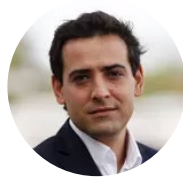
Stephané Séjourné Presidente de Renew Europe