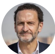
Edmundo Bal Vicesecretario General de Cs