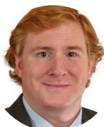
Ignacio Gragera Alcalde de Badajoz