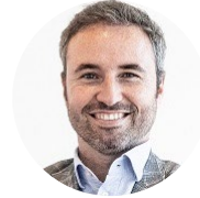
Guillermo Díaz Diputado de Cs (Moderador)