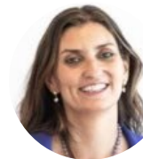
Sara Giménez Diputada de Cs