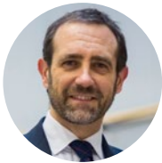
José Ramón Bauza Eurodiputado de Cs