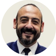
Jordi Cañas Eurodiputado de Cs