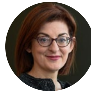
Maite Pagaza Eurodiputada de Cs